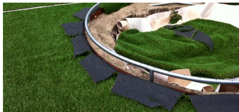
Insnijden van rondingen