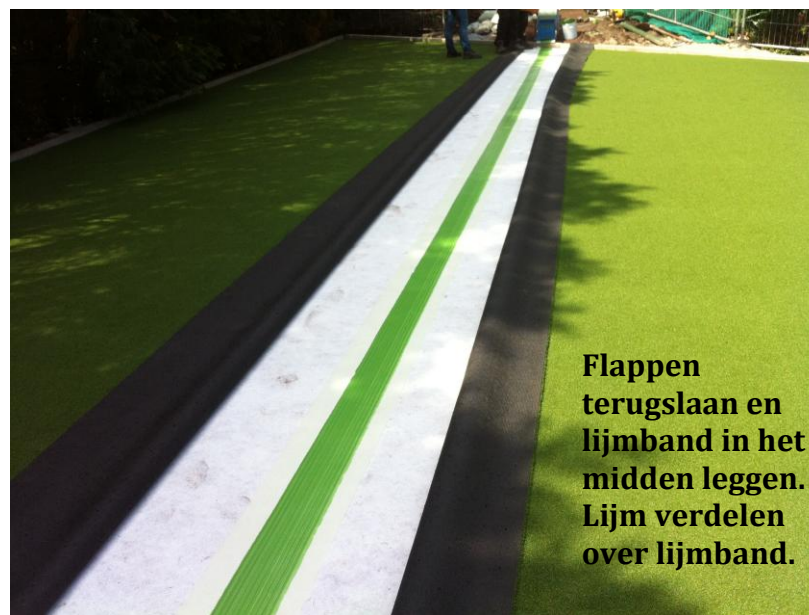
Flappen terugslaan en lijmband in het midden leggen. Lijm verdelen over lijmband.