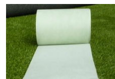
lijmband 30cm breed